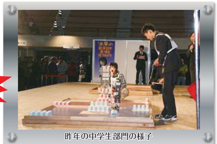
昨年の中学生部門の様子

〒640-8585 和歌山市小松原通一丁目1番地 和歌山県 商工観光労働部 企業振興課 経営支援班(担当:木戸上、阪口) TEL:073-441-2760 FAX:073-424-1199 E-mail:e0610001@pref.wakayama.lg.jp http://www.pref.wakayama.lg.jp/prefg/061000/homepage/index.html