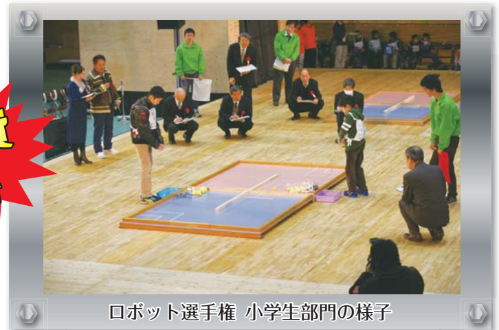
ロボット選手権 小学生部門の様子

〒640-8585 和歌山市小松原通一丁目1番地 和歌山県 商工観光労働部 企業振興課 経営支援班(担当:伊佐、城) TEL:073-441-2760 FAX:073-424-1199 E-mail:e0610001@pref.wakayama.lg.jp