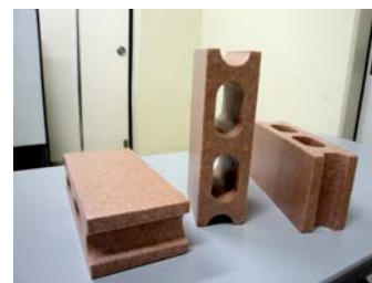
図3. ブロックの置き方

⑥審判が何らかの理由で競技の中断を判断した場合、ロボットを修復するためならば、ロボットを手で触る、相手の操縦エリアに立ち入ったりコートに手をつくなどの行為を行っても反則とならない。ただし相手の動作を妨害してはいけない。また、止むを得ない場合を除きブロックを手で触ったり動かしてはいけない。このときロボットがブロックを保持している場合はその状態のまま再スタートしてもよいが、ブロックを落としてしまった場合は競技に復帰するまでそのままの状態にしておくこと。