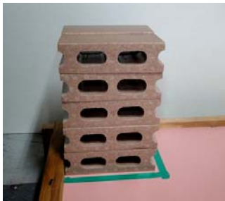
図1. ブロックエリアA (ロボットスタートエリアから見て)