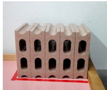
図2. ブロックエリアB (ロボットスタートエリアから見て)