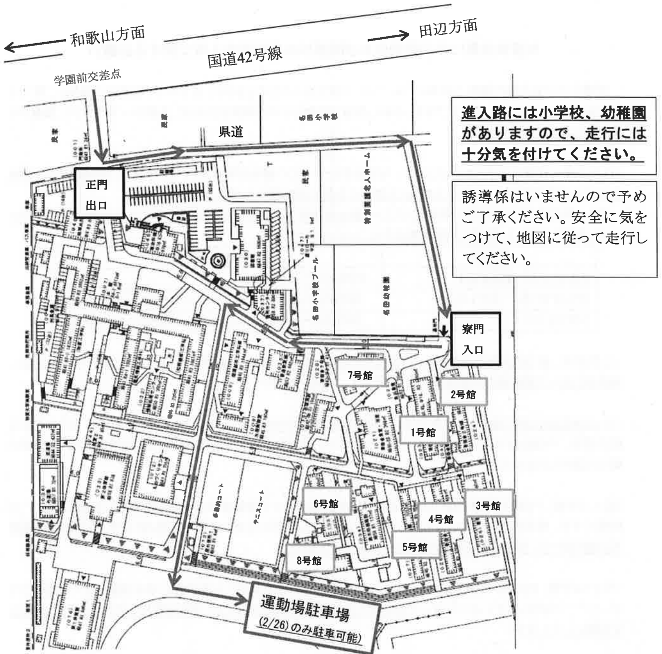
【図1】閉寮日(2/26(火))の15:00以前の通行